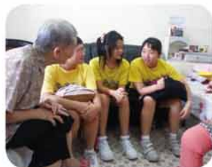
同學們與救主堂長者教友 談笑甚歡