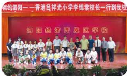
南京藝術交流之旅