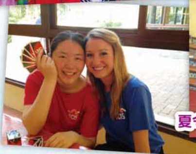
夏令營B：Concordia University of Irvine