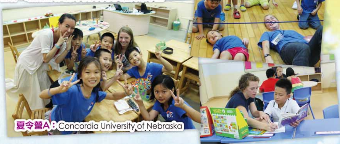
夏令營A：Concordia University of Nebraska

外籍教師：Concordia University of Nebraska 及 Concordia University of Irvine 的學生或畢業生 參加者：曦城協同國際學校同學及其他外來學生