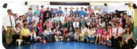
聖雅各堂遷堂荃灣廿一周年感恩崇拜大合照