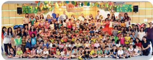
VBS團隊與學生大合照