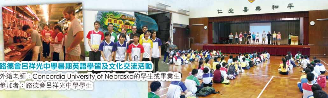
路德會呂祥光中學暑期英語學習及文化交流活動

期望來年能有更多學校及堂會可以合作組織主辦相關的暑期夏令營或暑期課程，讓本會與美國協同大學的伙伴關係可以持續發展下去，致令兩地的學生在文化交流，英語教授及學習方面均能獲益良多。